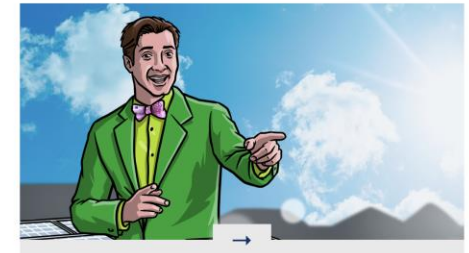
ZONNE-ENERGIEADVIES Ik wil zonne-energie opwekken met mijn bedrijf