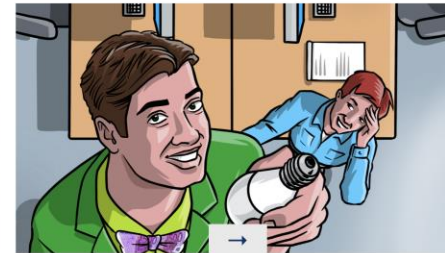
ENERGIEADVIES Ik wil energie besparen in mijn bedrijfspand