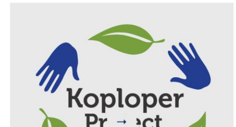
KOPLOPERPROJECT TOEKOMSTBESTENDIG ONDERNEMEN Ik wil meedoen aan het Koploperproject