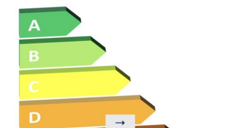
ENERGIELABEL-VERBETERING/REGISTRATIE Ik wil mijn energielabel registreren/verbeteren