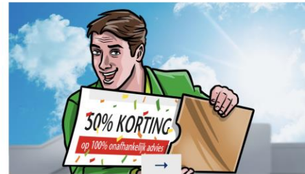
FOSSIELVRIJ ONDERNEMEN Ik wil een bedrijfsvoering zonder fossiele brandstoffen

Friese gemeenten zijn samen met de Freonen een unieke samenwerking gestart om ondernemers te helpen duurzame stappen te zetten. In Harlingen, Leeuwarden en Waadhoeke geldt zelfs een korting van 50% op de advieskosten. U kunt de Freonen inschakelen voor directe uitvoering van maatregelen of voor advies op maat, uiteraard in uw eigen tempo. Op basis van uw behoefte en situatie verwijzen wij u door naar de juiste partner.